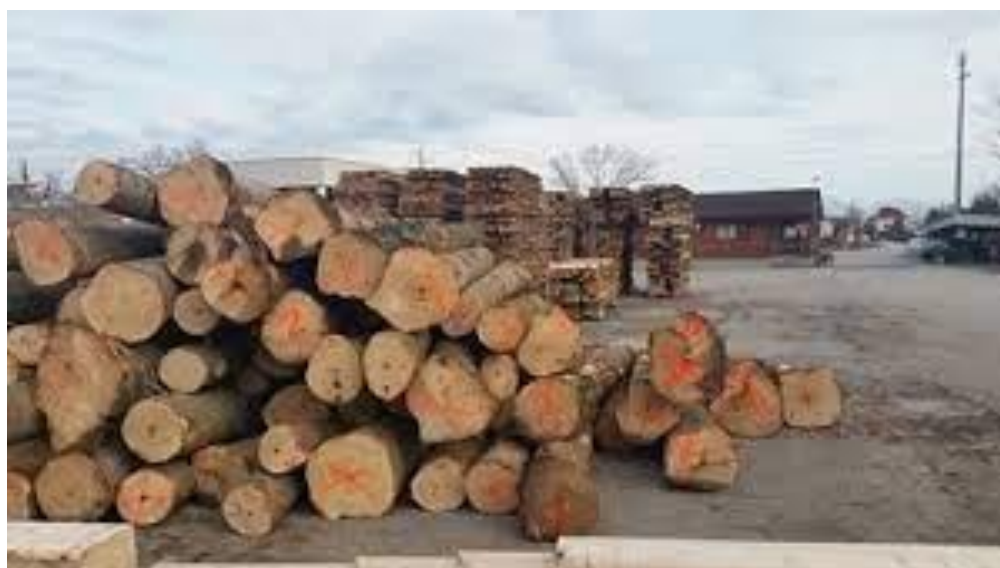
Prodotto pronto per la segheria